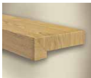
Typ C Hrana – pravý ohyb