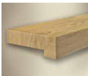
Typ C Hrana – levý ohyb