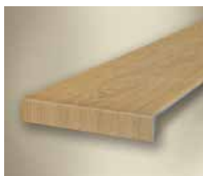
Typ C Průběžný – levý ohyb